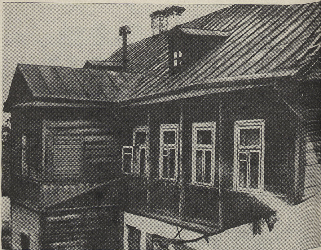
Дом у Мінску, у якім нарадзіўся Максім Багдановіч.

Прагна слухаў Максім Багдановіч расказы супрацоўнікаў рэдакцыі «Нашай нівы» аб пашырэнні ў народзе, нягледзячы на ўсе цяжкасці, друкаванага беларускага слова; знаёміўся са зборамі старадрукаў і унікальнай калекцыяй сліцкіх паясоў, якія знаходзіліся ў памяшканні рэдакцыі газеты.