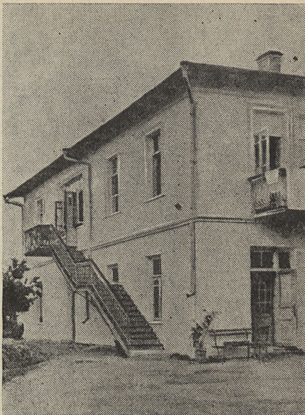
Дом у Ялце, дзе памёр Максім Багдановіч.

...І ў гэты час яна, Здавалася, была аж да краёў паўна Якойсь шырокаю, радзімаю красою, І, помню, я на міг пахарашэў душою.